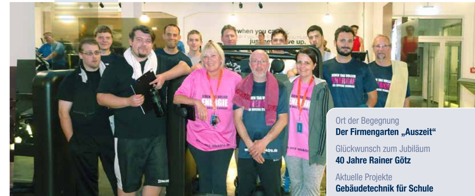
Ein wesentlicher Motivationsfaktor ist natürlich auch das Zusammentreffen von Kolleginnen und Kollegen beim Training und somit eine weitere Stärkung des Miteinanders. 25 Kolleginnen und Kollegen haben sich für den Fitnessführerschein angemeldet und inzwischen die ersten Trainingseinheiten absolviert.