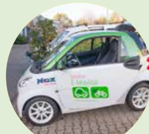
E-Mobil + E-Bike