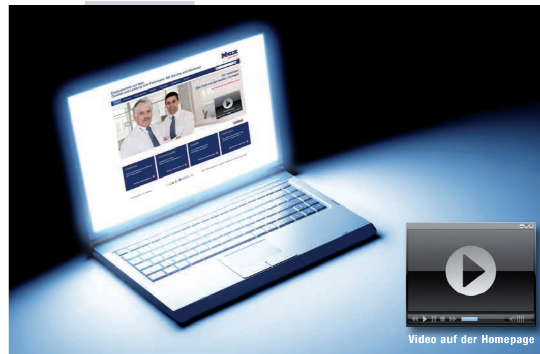
Video auf der Homepage